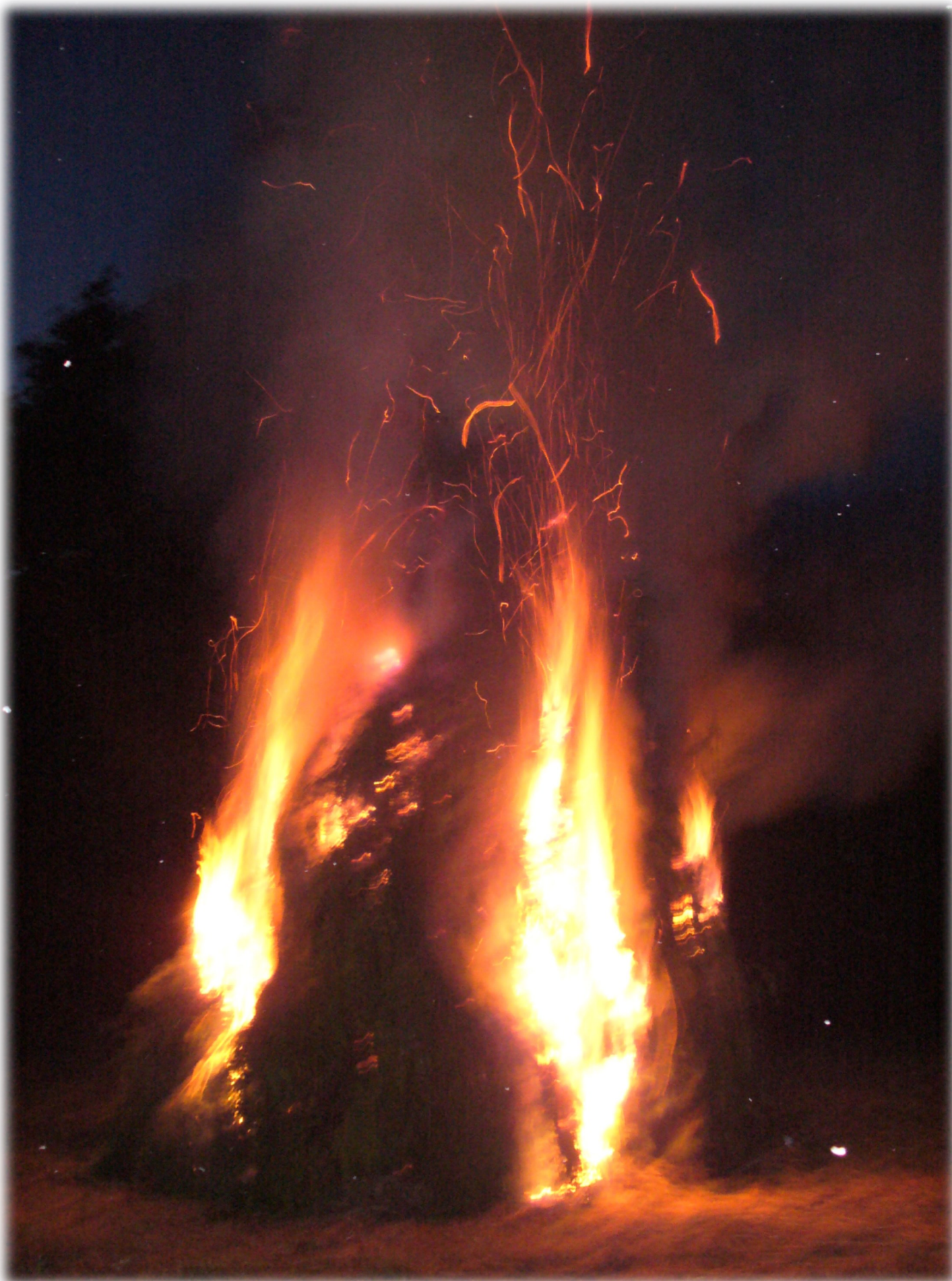
Feu de la Saint-Jean à St-Léger-La-Montagne