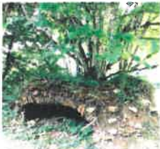
Un four à pain ?

A droite, prendre le chemin qui descend. En bas de cette descente, sur la gauche se trouve la Tourbière de Mallety . La rivière la Couze, bénéficiant des divers écoulements, y débute son cours et se jettera dans la Gartempe dans la commune de Rancon après un parcours de 35,2 km.