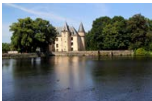
Vue sur le château et son étang

Gratuit. Sans réservation. Convient au jeune public. Accès handicapé. Groupe limité à 10 pers. Mesures sanitaires respectées.