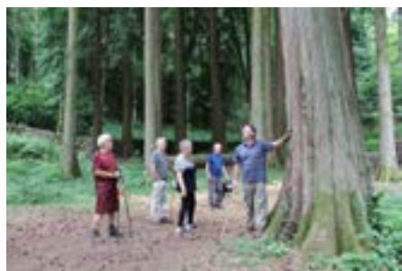
Arboretum de La Jonchère

Sur réservation : 20 pers. maximum. Mesures sanitaires respectées.