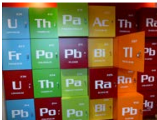
Musée URÊKA accueil