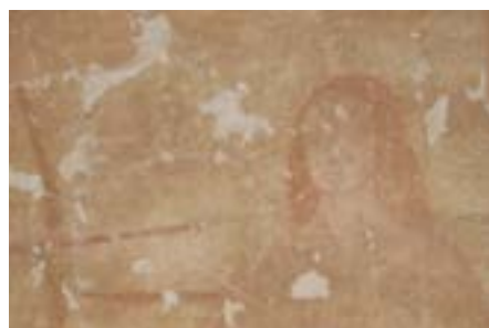
Martyre de Saint-Sébastien