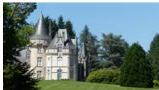
Vue sur le domaine de Bort