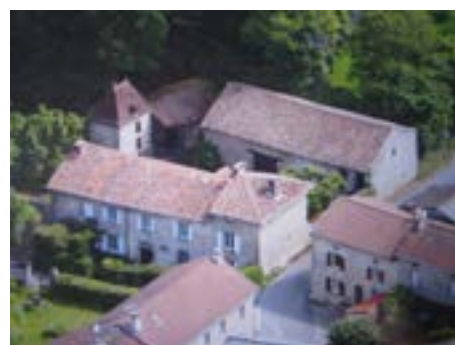
Vue aérienne de l'ensemble des bâtiments

Accès handicapé. Mesures sanitaires respectées.