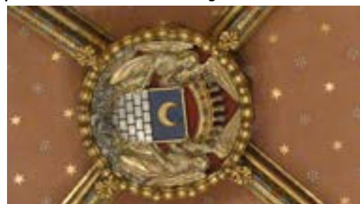
Décor de la chapelle du château classée MH