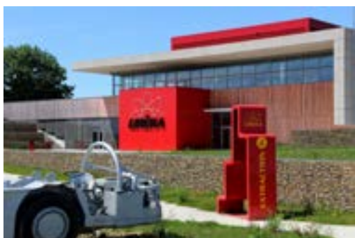
Musée URÊKA parc aux machines

Tarif réduit : adulte 6 €, 7 à 17 ans 3 €, gratuit jusqu'à 6 ans. Sur réservation. 10 pers. maximum. Accès handicapés. Mesures sanitaires respectées.