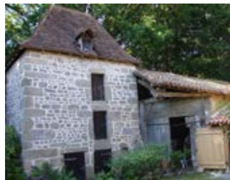
Pigeonnier classé de 1716