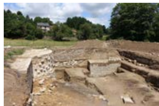
Les fouilles archéologiques