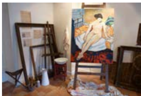
Espace Valadon atelier de peintre