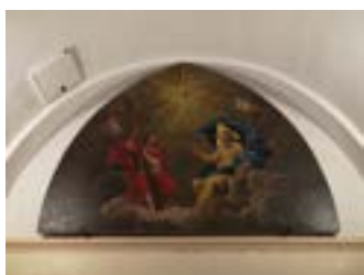
Le tableau La Trinité