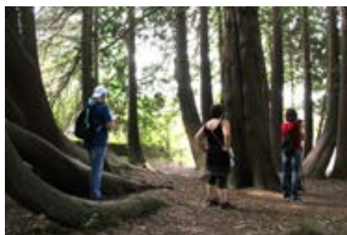
Le parc du château