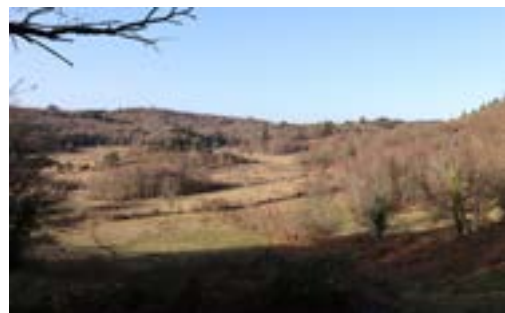
Point de vue sur la tourbière

obligatoire, sortie limitée à 9 personnes en raison de la covid. Mesures sanitaires respectées.