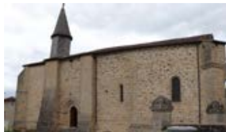
Mur sud de l'église