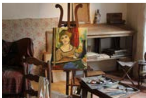
Espace Valadon atelier de peintre

Visite libre et gratuite. Sans réservation. Livet 3-6 ans et quizz 7-11 ans disponible sur demande. Accès handicapés sur demande. Accès limité en fonction de l'affluence. Mesures sanitaires respectées.