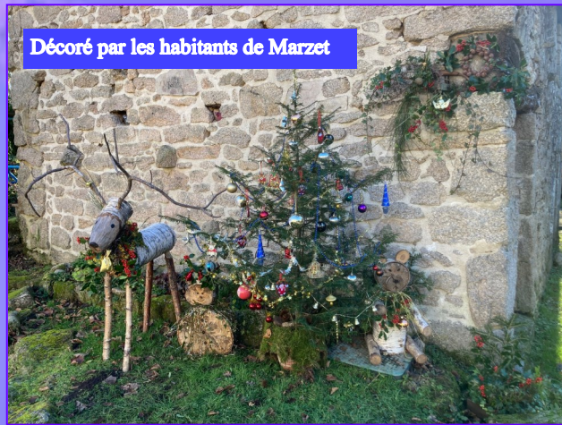
Décoré par les habitants de Marzet