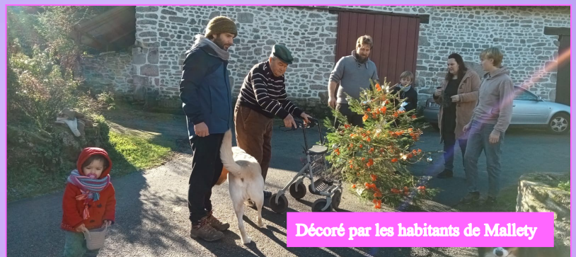
Décoré par les habitants de Mallety